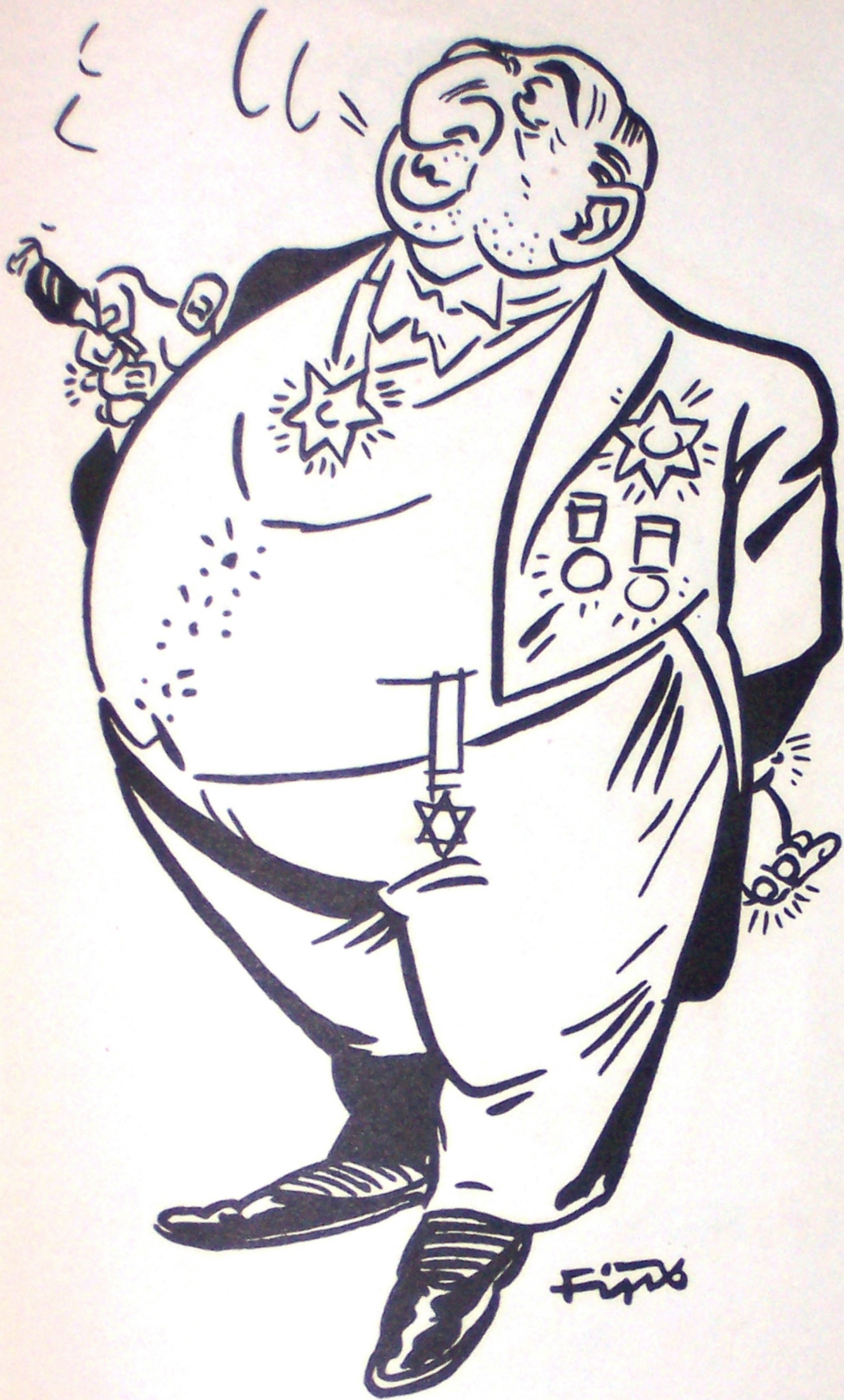
Der anständige Jude