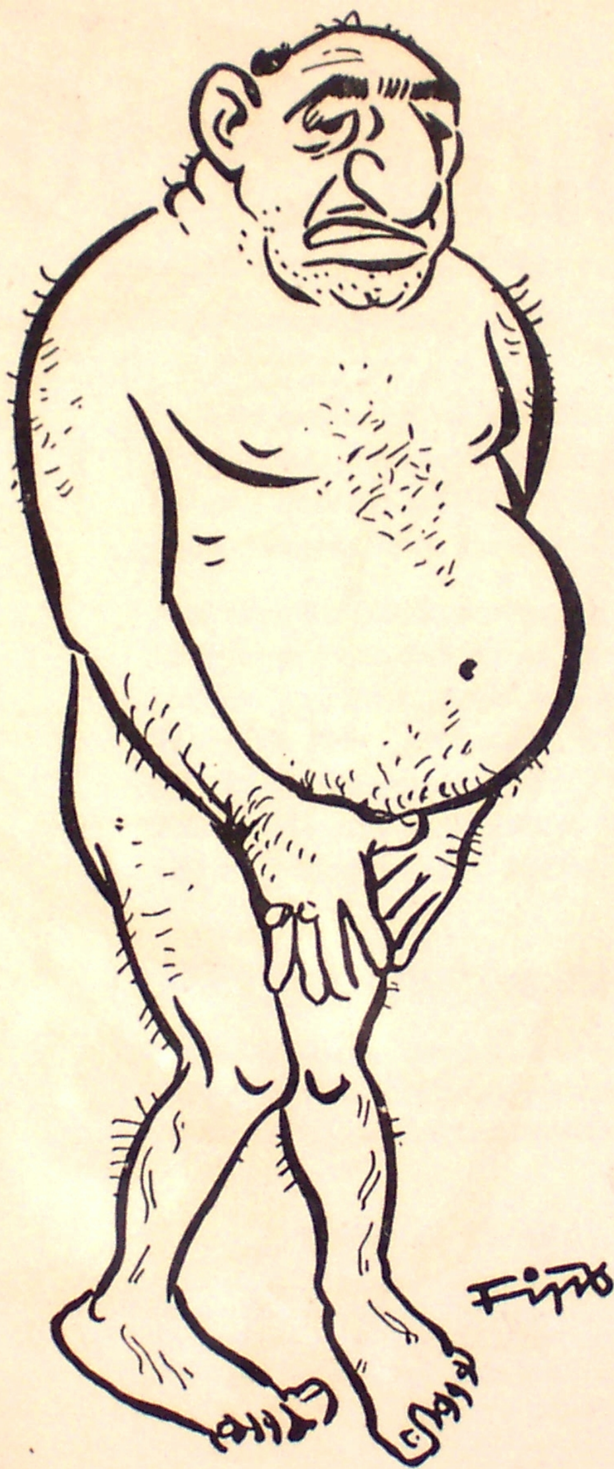
Die nackte Wahrheit